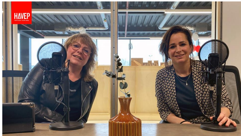
[Nachhaltiges Unternehmertum – Newsletter]