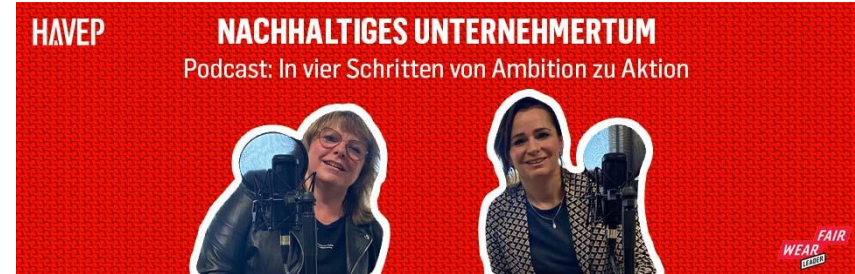
[Nachhaltiges Unternehmertum - E-Mail-Signatur]