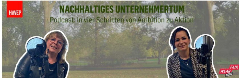
[Nachhaltiges Unternehmertum - Website Banner]